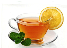
a cup of tea